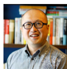
福島特許事務所 弁理士

著作：『強い地元企業をつくる 事業承継で生まれ変わった10の実践』(学芸出版社)