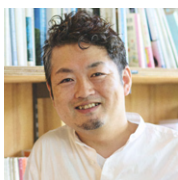
株式会社SASI 代表取締役